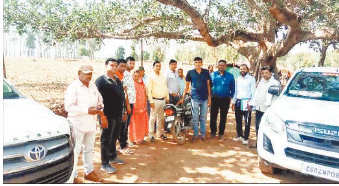
क्षेत्रीय अधिकारी से चर्चा करते ग्रामीण।