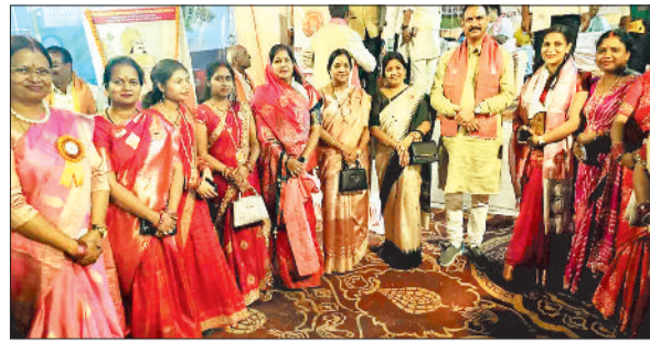
कैबिनेट मंत्री के साथ समाज की महिलाएं।

रात के समय राहगीर सहित एसईसीएल के कर्मचारी रात के अंधेरे में आवागमन करने की मुश्किल है। बताया जा रहा है प्रबंधन अपने मद से छग ढाबा से लेकर गायत्री खदान तक लगभग दो सौ नग रोड लाइट लगाया था जिसमें गायत्री खदान से मेन रोड तक का अधिकांश लाइट चोरी हो गया है। हैरानी की बात तो यह है कि आज तक घटना की सूचना पुलिस को नहीं दी गई है कि कितने एसईसीएल के गायत्री खदान में तीनों शिफ्ट में कार्य करने अधिकारी कर्मचारी पहुंचते हैं। ऐसा नहीं है कि सीसीएल प्रबंधन को चोरी हुई स्ट्रीट लाइट की जानकारी है लेकिन एसईसीएल के फील्ड कर्मचारी अनजान बने हुए हैं जिससे चोरों के हाईलेट बुलंद है जिसका खातिमायाजा क्षेत्र के लोगों को भुगतना पड़ता है।