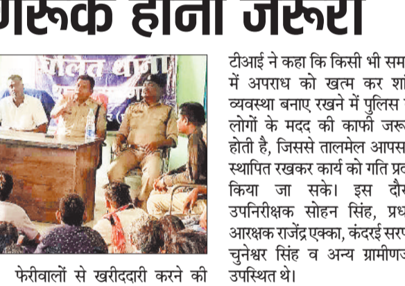
हरिभूमि न्यूज ▶▶ बिश्रामपुर